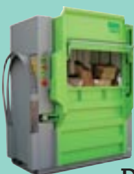
DIXI 60, 80 S

Pressdruck 25-30 t Ballengewicht 250-360 kg