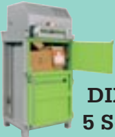
DIXI 5 S-K