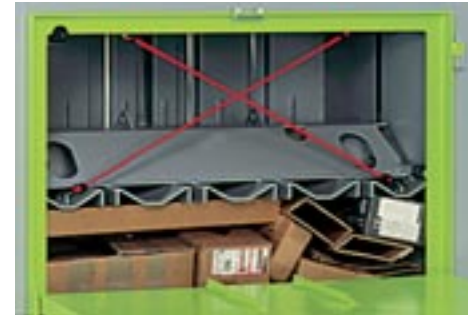
Robust: Der beidseitig geführte Pressstempel