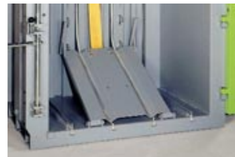
Leicht zu bedienen: Der Auswerfer