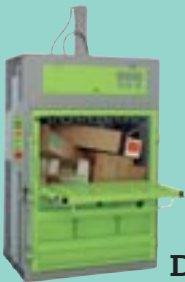
DIXI 25, 30 S

Pressdruck 25-30 t Ballengewicht 250-360 kg