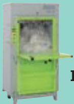
DIXI 10 S