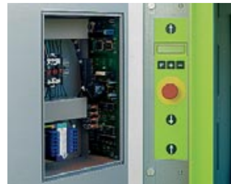
Wartungsarm: Die Microprozessorstuerung